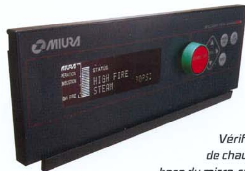
Vérificateur de chaudière à base du micro-système informatique XJ1